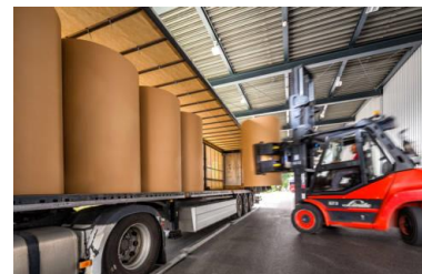
Testliner Braun Rohpapier